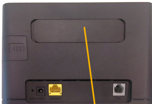
Tapa conectores de antena