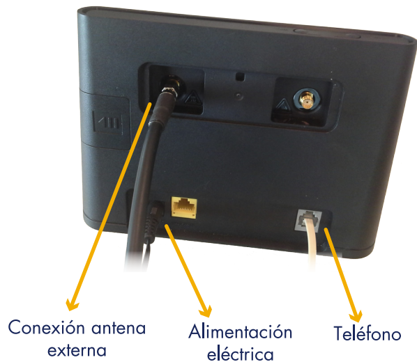
Conexión antena externa